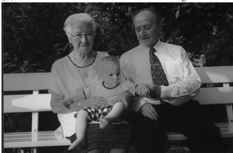
De jubilarissen met (voorlopig) het jongste kleinkind: een generatiekloof van 85 jaar!

Bij deze gelegenheid werden ze letterlijk en figuurlijk in de bloemetjes gezet tijdens een grandioze receptie, waarop een uitgebreide delegatie van het Priester Daensfonds aanwezig was. Wij wensen hen nog vele jaren met een fijne gezondheid en een onverminderde ijver en werklust in dienst van ons aller Vlaanderen. Hou zee!