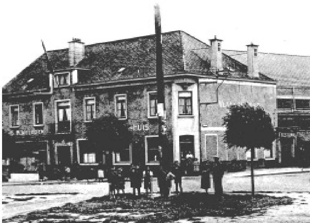
Lokaal Weldoen - Vlaamsch Huis in Welle (DAVS)

In de winter van 1913 richtten de daensisten van Welle een maatschappij van onderlinge bijstand op onder de naam “Met eigen kracht naar eigen redding”. Wellicht is uit deze maatschappij in 1921 en onder impuls van Romain Eeman, de coöperatieve maatschappij “Weldoen” ontstaan, die na verloop van tijd een toneelvereniging, een fanfare, een boldersclub, een ziekenbond, een pensioenkas en zelfs een herberg met feestzaal en een