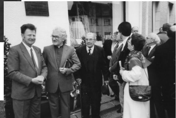
Voorjaarsactiviteit in Okegem (april 1993)