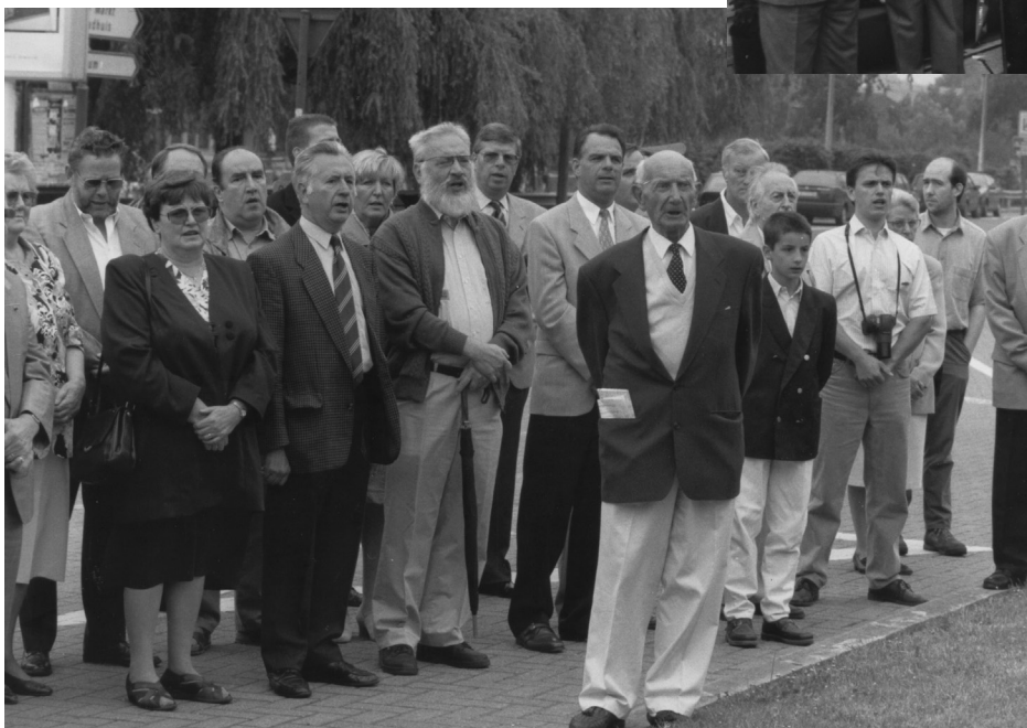
Daensdag 1996: op de Werf in Aalst bij het standbeeld van Daens.