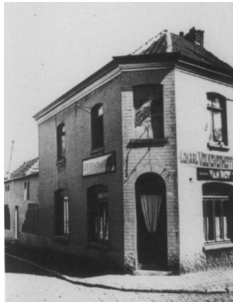
Lokaal "Vlaamsch Huis Volksverheffing" in Moeskroen jaren vijftig (Kortrijk, W-Fl.)

Enige informatie in o.m.: W. DECONINCK, Daensistische beweging in Zuid-Vlaanderen , in Priester Daens , VII (1983), 3, blz. 15-17. F. Van Campenhout, Lexicon van de Daensistische Beweging , 1993. M. Van de Perre, Redt & Helpt U Zelfen & Elkander. Of hoe de Daensistische Beweging de sociale problemen bestreed , 1997.